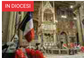
La “Missa pro natione gallica”, ponte tra la Francia e Roma