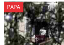
Francesco: «Si arrivi al Natale con il cessate il fuoco su tutti i fronti di guerra»