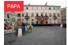
Il Papa: aspettando il Giubileo, concentrarsi sui «cantieri dell'anima»