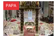
Il Papa: «Non c'è salvezza senza la donna. Anche la Chiesa è donna»