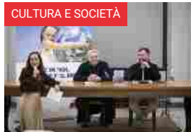
De Maria (Italia Solidale): la sfida di “Essere pace nel mondo”