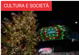
Il “Natale in Auditorium”