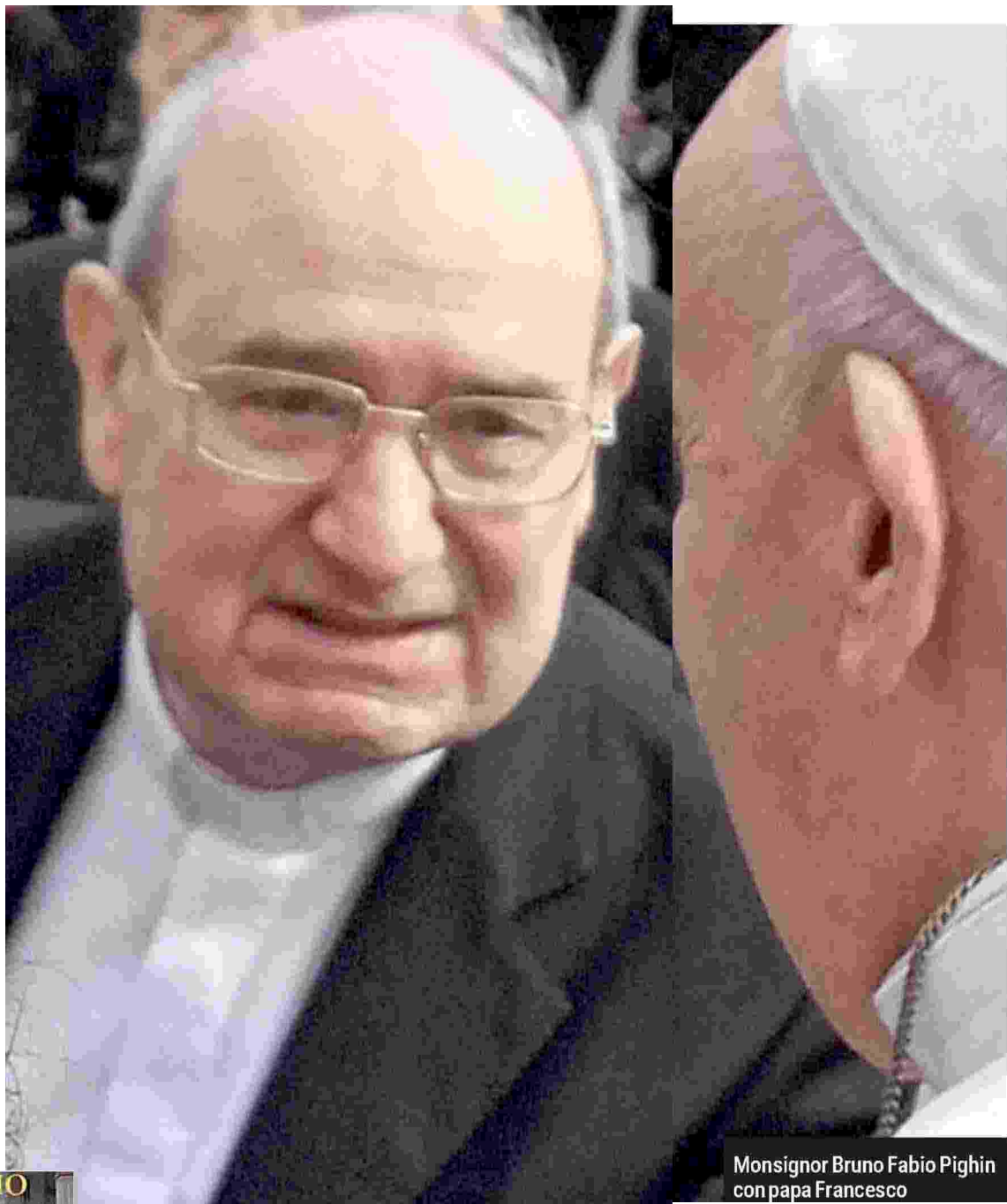
Monsignor Bruno Fabio Pighin con papa Francesco