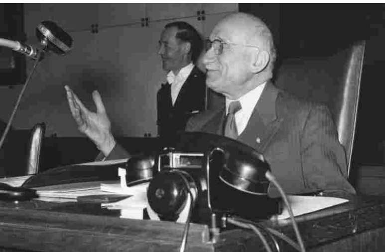
Robert Schuman a Strasburgo nel 1958

"L'Europa è divenuta smemorata: ha contratto progressivamente la memoria, non percepisce più il dramma"